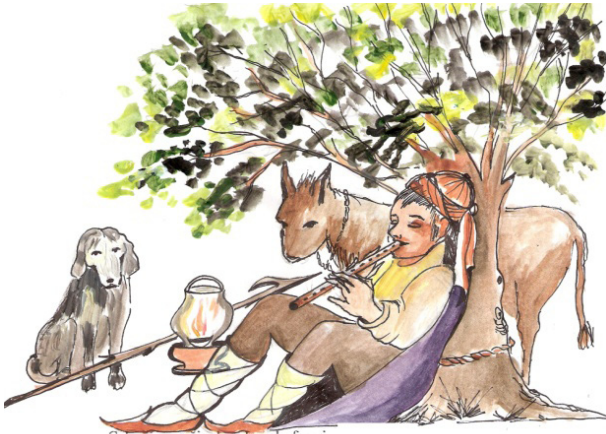
Şekil 2. Çobanın Eşyaları ve Yardımcıları

Çoban Kırklığı; Makastan daha kaba yün kırkmaya yarayan alettir. Adı; "Kırk kırk" sesinden gelir.